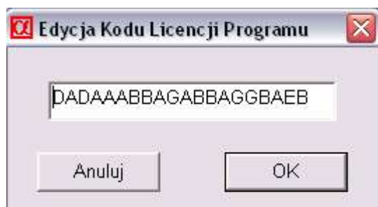
Rys 2. Wpisywanie „Kodu Licencji Programu”.

Kod Licencji Programu wpisywany jest w AlfaCentrali. Po otwarciu listy reprezentantów z menu operacje należy wybrać operację „Kod Licencji Programu”