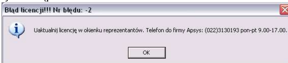
Rys 3. Problem z Kodem Licencji Programu

a) AlfaCentrala wyświetla okienko jak na Rys.3, a po uruchomieniu większość opcji menu jest niedostępna.