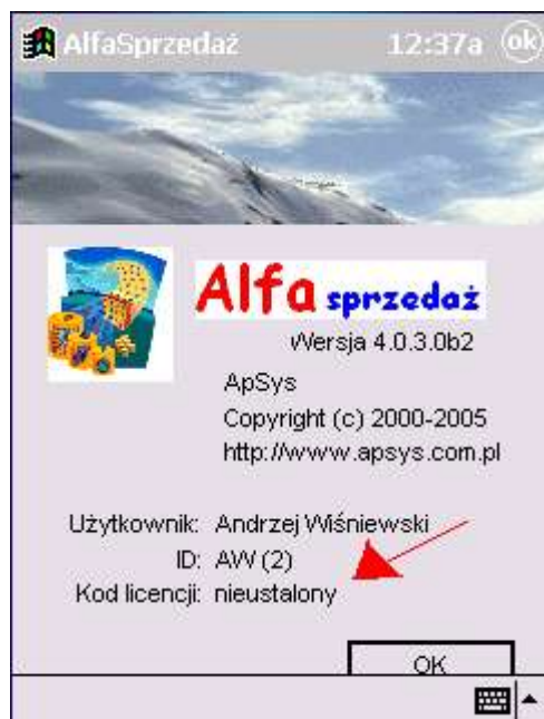
Rys 1. Okienko „O programie” - otwierane z menu „?”

Z każdym palmtopem związany jest kod zwany „ Kodem Licencji ”. Kod ten widoczny jest po uruchomieniu w okienku „O programie” otwieranym także z menu opcję „?” (z prawej strony menu). Ten kod można odczytać po uruchomieniu okienka „O programie” z pomocą opcji menu „?”